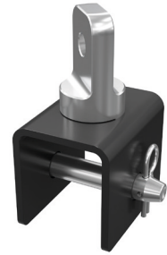
GABELKOPF ABGANG 2