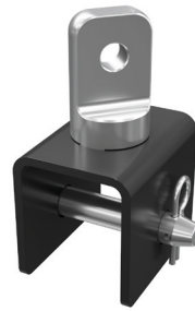
GABELKOPF ABGANG 1